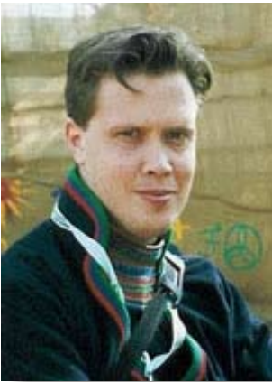
Govva: Alle Javo